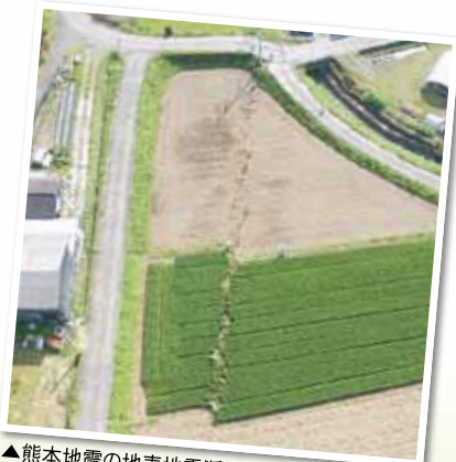
▲熊本地震の地表地震断層

本講座は、「工科系コンソーシアムによるものづくり教育の拠点形成 (平成20年度文部科学省戦略的大学連携支援事業)」の一環として、平成21年10月に開講したものです。