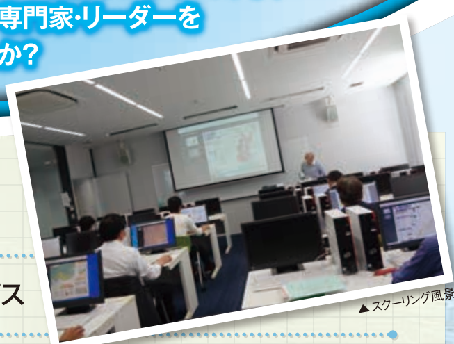
▲スクーリング風景

大学の教育・研究資源を活かした高度な教育プログラムの下、 職場や地域における防災の専門家・リーダーを 目指しませんか？